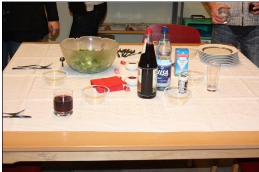
Feldsalat mit Senf-Ei-Dressing:

gelernt haben, die uns wohl immer positiv in Erinnerung bleiben wird.