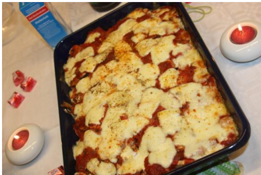
Brotauflauf à la Toskana: