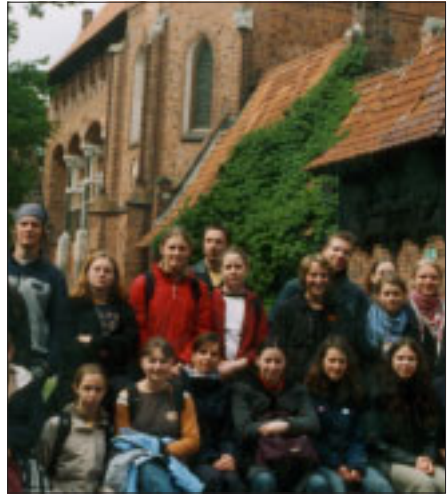
Chormitglieder vor der Marienburg.

Der sich anschließende Ausflug zur Marienburg an der Nogat und nach Dan-