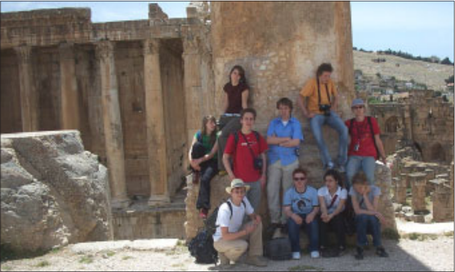
Die ganze Schülergruppe vor dem römischen Baccustempel (2. Jh.) in Baalbek.

auch Besuche einer deutschen Schule, der ›American University of Beirut‹ sowie des Goethe-Instituts. Außerdem waren wir zum Beiruter Bürgermeister, ins libanesisches Tourismusministerium sowie zu einer der zwei weiblichen Parlamentsabgeordneten eingeladen. Überall führten wir sehr interessante Gespräche und stießen immer wieder auf rege Begeisterung, wenn wir für unser Projekt warben. Unsere Fremdsprachenkenntnisse waren dabei mehr als hilfreich, und wir waren sehr dankbar, daß so gut wie jeder Libanese auch sehr gut englisch oder französisch sprach, so auch unsere Gastschüler, die für viele von uns zu echten Freunden geworden sind.