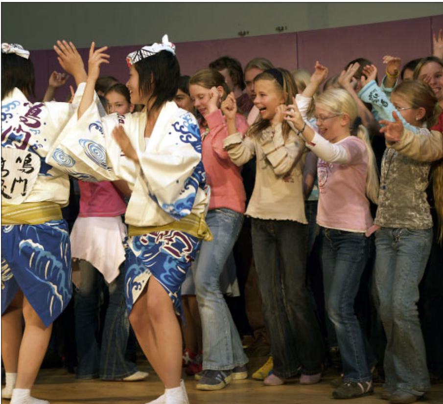
Schlussstil des Awa-Odori-Tanzes: Großer Spaß beim Mitmachen.

ging begeistert mit. Die Eltern der Bläserklassen hatten ein Buffet vorbereitet, und so war nach der Veranstaltung für unsere Schüler noch Gelegenheit, mit den Japanern ins Gespräch zu kommen.