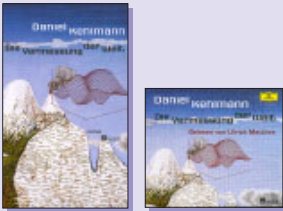
Daniel Kehlmann: Die Vermessung der Welt

Daniel Kehlmann beginnt mit seiner Geschichte im September 1828 in Göttingen. Carl Friedrich Gauß, 51 Jahre alt, polternd und schon ziemlich schrullig, reist widerwillig mit der Kutsche nach Berlin. Alexander von Humboldt hat ihn dorthin zum Deutschen Naturforscherkongress eingeladen.